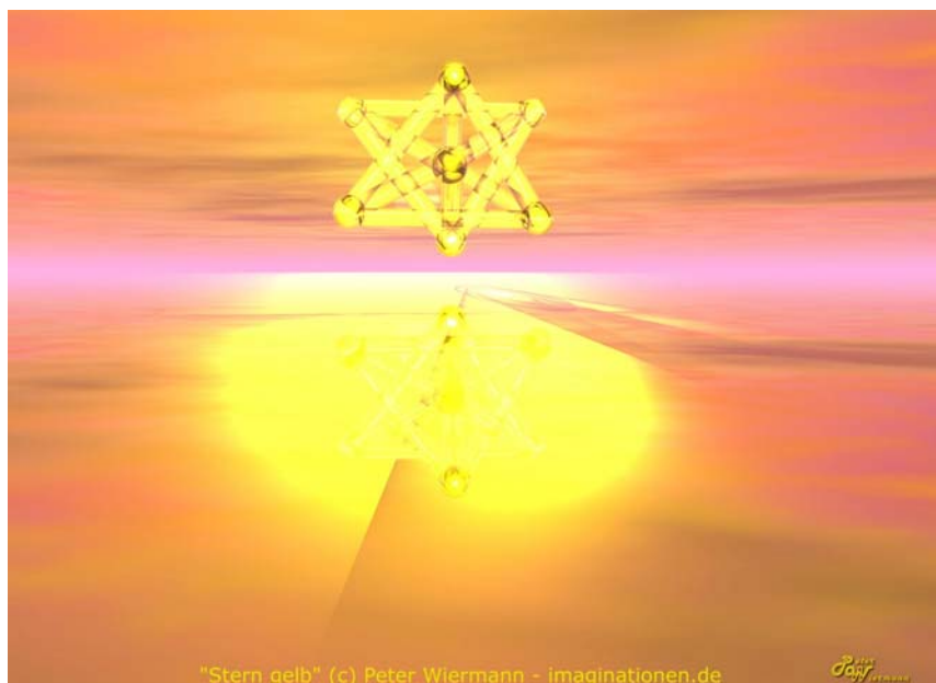
"Stern gelb"

Schau dir dein Leben einmal an, wie es noch vor zwei oder drei Jahren aussah. Wo hast du damals gestanden und wo stehst du heute? Wie hast du